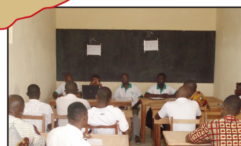
In diesem Klassenzimmer wurden die Lehrer der neuen Schule über das Konzept informiert.